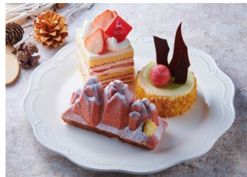
YATSUDOKI クリスマスケーキ 2021