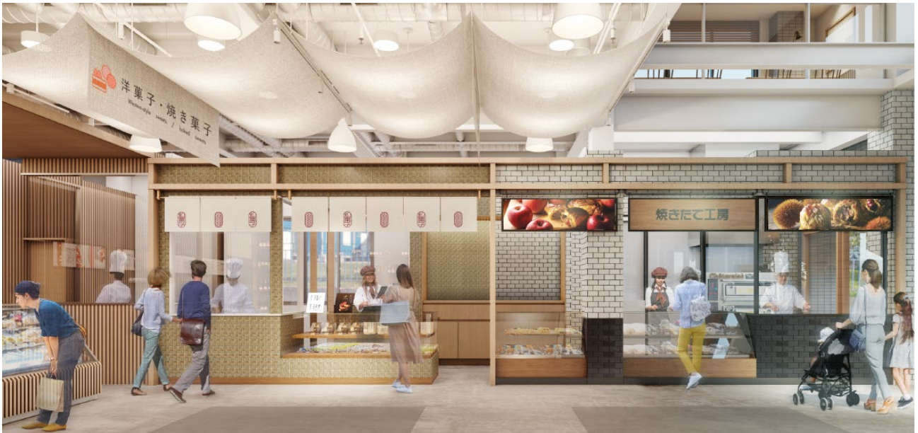
※1F 店舗内観イメージ