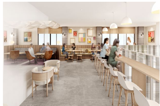
※2F イートインスペース（イメージ）